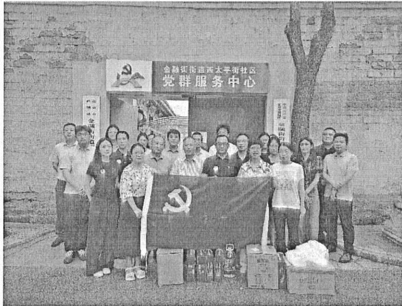
党支部联合工会开展“走进社区送温暖”活动