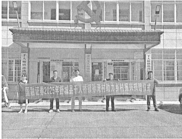
公司助力乡村振兴 爱心捐赠活动